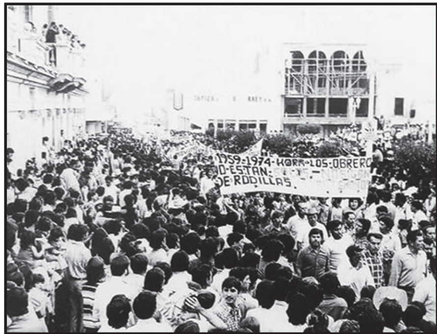
Desfile obrero del Primero de mayo de 1974. Saltillo, Coahuila.

Volvamos a la asamblea obrera. Los estudiantes “comunistas” llegamos hasta la puerta del sindicato, y mientras repartíamos los volantes, un grupo de porros de la CTM intentaron agredirnos si no abandonábamos el lugar, pero los asambleístas fueron avisados, salieron a defendernos y nos introdujeron a la asamblea, en donde por unanimidad destituyeron a la