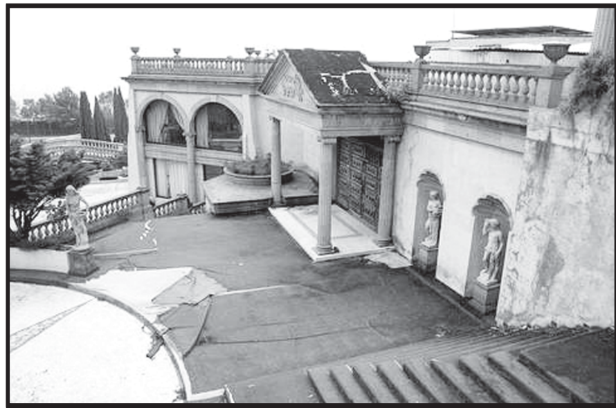
El Partenón o Monumento a la corrupción.

Bástenos recordar que finalmente, la ciudadanía cansada ya de tanta corrupción en los diferentes niveles de gobierno, decidió dar la espalda a los políticos de los partidos gobernantes y depositar su confianza en un hombre que durante años se le había negado la oportunidad de llegar a la Presidencia de la República, Andrés Manuel López Obrador, así como a los candidatos