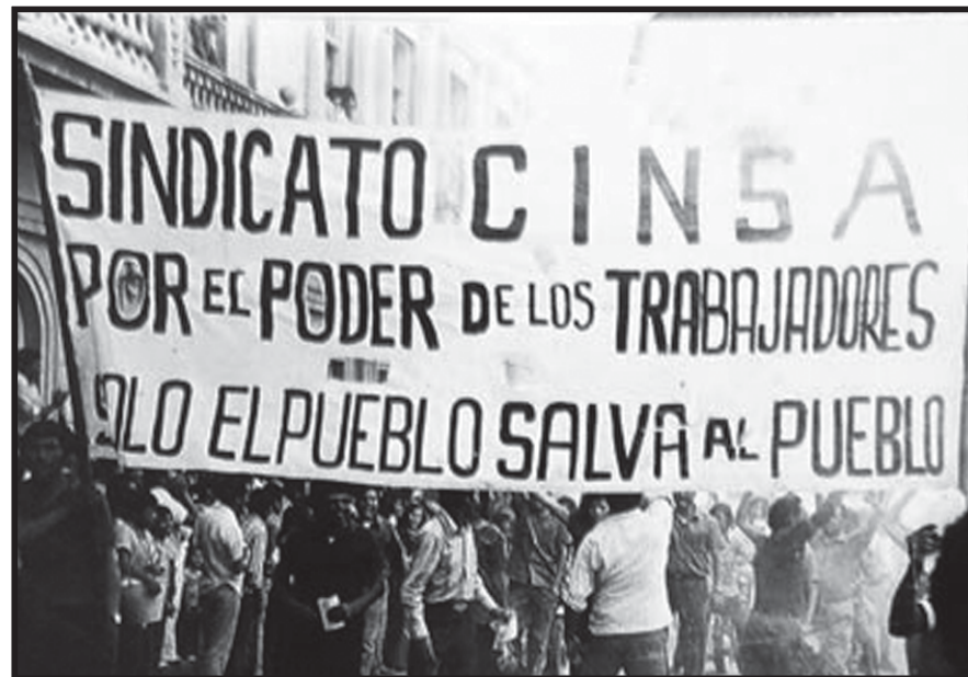
Una manta de los huelguistas en el desfile obrero de 1974.