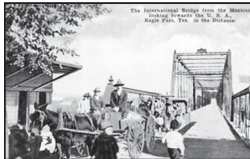
Puente internacional de Piedras Negras-Eagle Pass.

El día de hoy, un amigo me preguntó. - ¿Es la primera vez que ocurre en Piedras Negras el fenómeno de los migrantes hondureños? La respuesta no fue fácil, en un intento de localizar en mi mente algún dato histórico, al menos hasta la fecha no se encuentra algo parecido por parte de un grupo extranjero que llegara a esta ciudad en una caravana de casi mil personas. Le respondí: No.