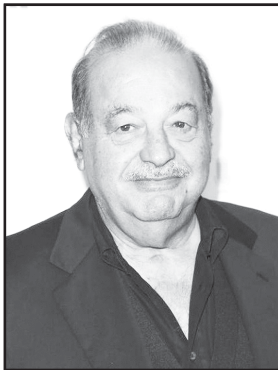
Carlos Slim Helú. Prestanombres de los corruptos.

La prensa en general, el PRI, el PAN, el PRD y otros partidos afines a estos, representan según estudios sobre las preferencias del electorado, apenas el 15% y, la décima parte de estos son los que hacen mucho ruido en los medios para descalificar todas las acciones de López Obrador, en lugar de invertir ese esfuerzo en salir del basurero en el que se encuentran debido a sus malas artes, a sus incapacidades y complicidades con la oligarquía para aprovecharse de la gente,