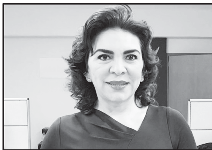
Ivonne Ortega Pacheco. “Regresar al PRI a sus orígenes”.

La fortaleza de un partido, de cualquier partido político en cualquier país con cualquier tipo de gobierno radica en las mayorías y el PRI siempre se ha sustentado en base a una minoría rapaz y autoritaria, razón por lo que se ha vuelto necesario, mejor pensar en darle su sana sepultura. Es más fácil y resulta más barato y menos complicado conformar un nuevo partido y olvidarse del PRI, porque en la praxis resulta ser lo mismo que un cartucho quemado o pólvora mojada. Su actual dirigencia piensa que sí es posible reconstruir el partido sin embargo reitero, es mejor conformar otro nuevo.